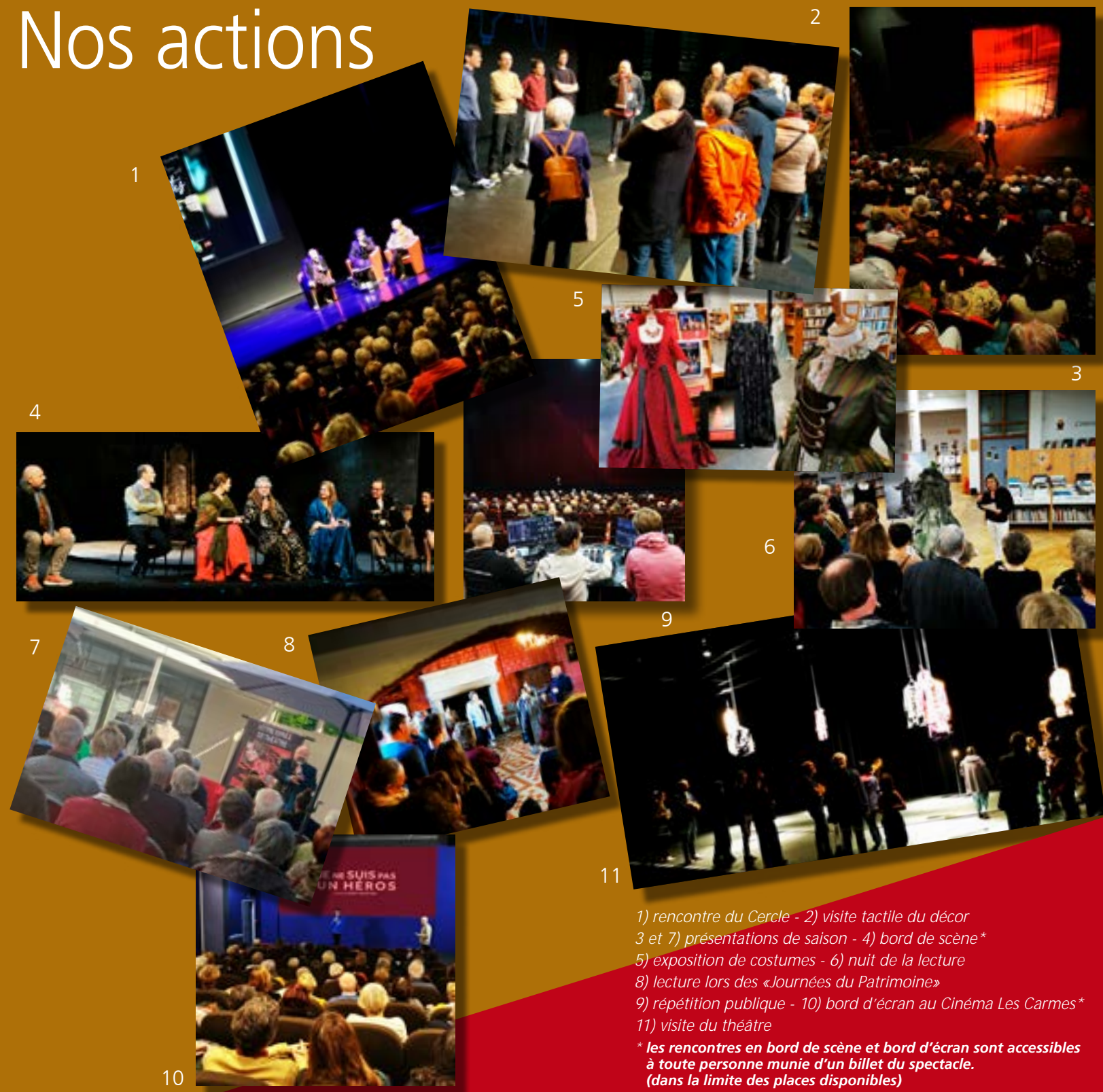
1) rencontre du Cercle - 2) visite tactile du décor 3 et 7) présentations de saison - 4) bord de scène* 5) exposition de costumes - 6) nuit de la lecture 8) lecture lors des «Journées du Patrimoine» 9) répétition publique - 10) bord d'écran au Cinéma Les Carmes* 11) visite du théâtre * les rencontres en bord de scène et bord d'écran sont accessibles à toute personne munie d'un billet du spectacle. (dans la limite des places disponibles)