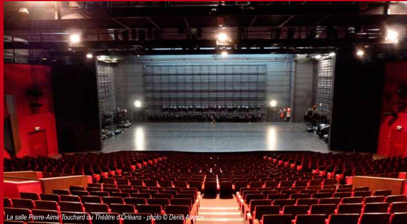
La salle Pierre-Aimé Touchard du Théâtre d'Orléans